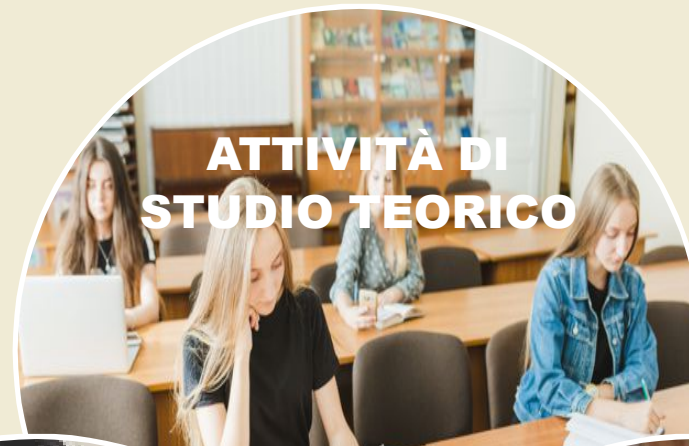
ATTIVITÀ DI STUDIO TEORICO