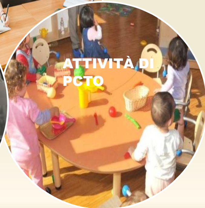
ATTIVITÀ DI PCTO