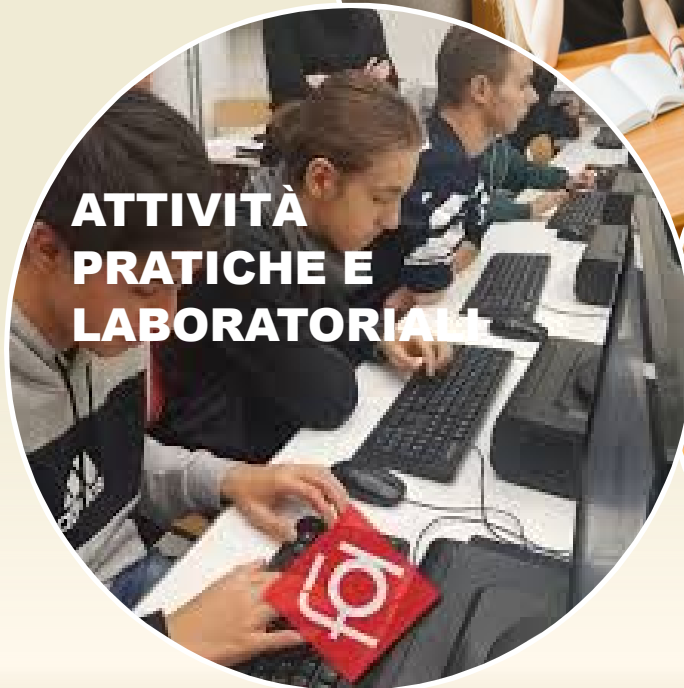
ATTIVITÀ PRATICHE E LABORATORIALI